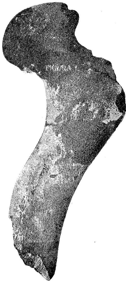
Húmero del lado izquierdo del Testudo Burchardii E. Ahl.