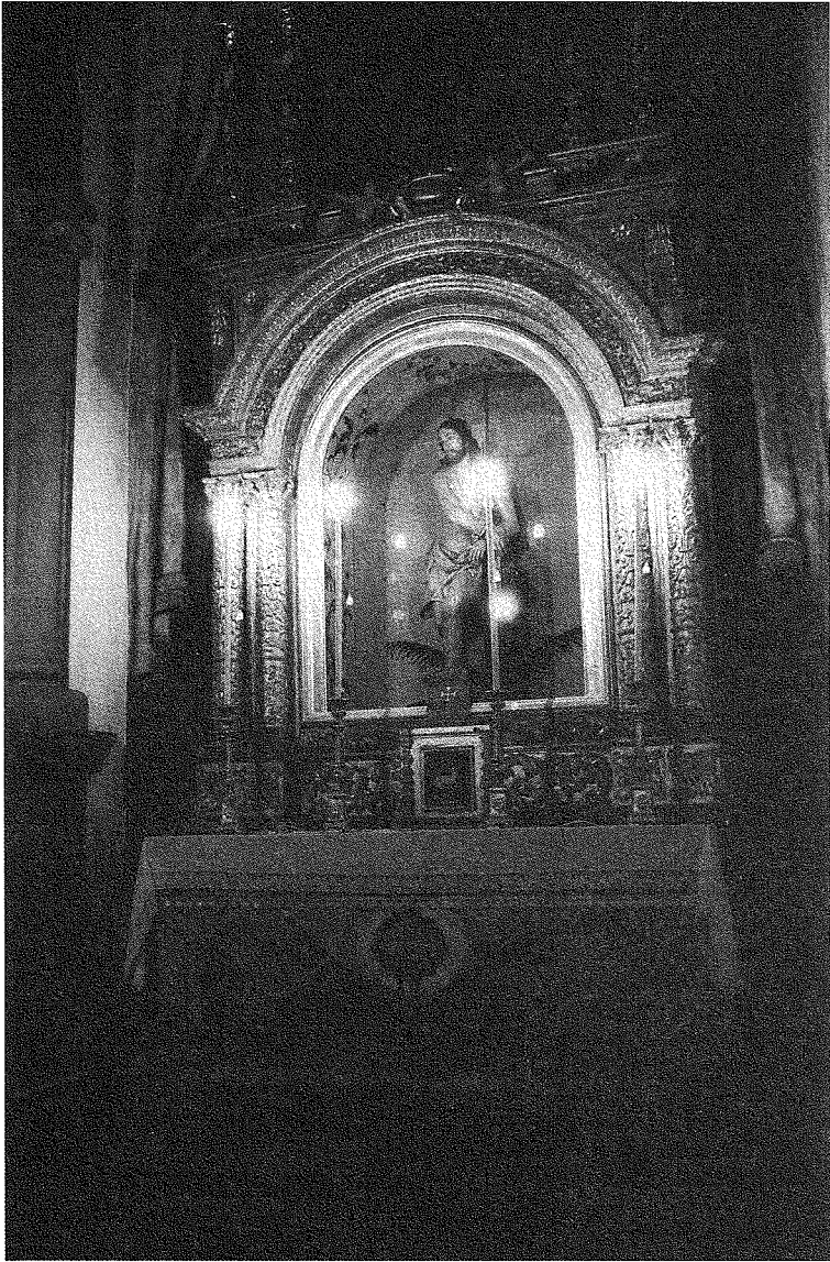
Lámina V. Capilla de Santo Tomás, de la familia Van de Walle, en la Iglesia del Convento del Patriarca Santo Domingo. Santa Cruz de La Palma.